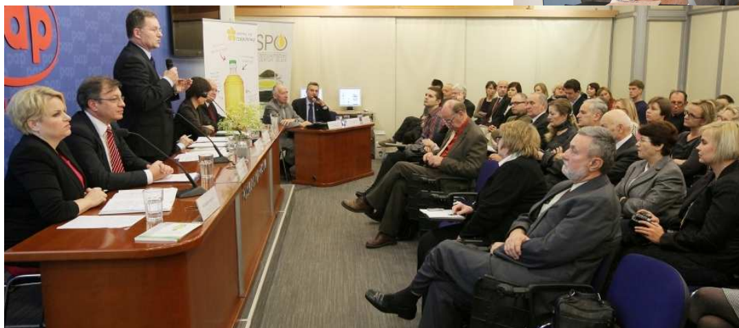
W konferencji wzięło udział blisko 50 dziennikarzy i około 30 gości